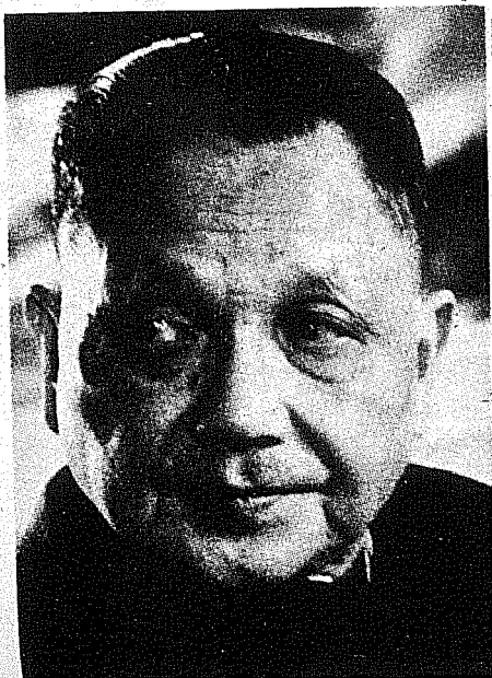
Teng Hsiao-Ping: tiene una delicada misión

Por otra parte, dicha expansión sobre todo en Europa Oriental significó una contracción de los mercados mundiales para los países capitalistas y la pérdida de importantes fuentes de materias primas. Esto se agudizó aún más debido a la intensificación de las hostilidades características de la guerra fría, obligando a los Estados Unidos a limitar el comercio con los países comunistas en lo relativo a todos aquellos productos considerados "estratégicos". Obliga también a los Estados Unidos (después del lanzamiento del Sputnik, 1957) a considerar que la Unión Soviética era un sistema viable, capaz de un