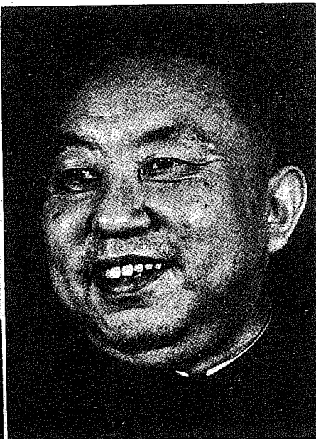
Hua Kuo-Feng: mantiene el control chino