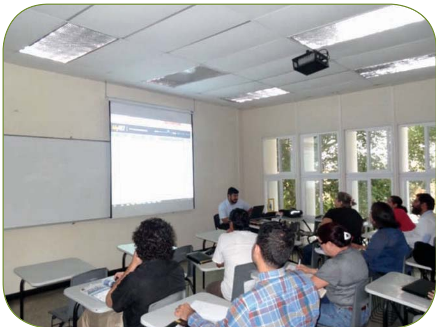
Docentes en capacitación de la plataforma digital MyELT

El campus cuenta con más de quince laboratorios relacionados con diferentes áreas: ciencia de los materiales, máquinas hidráulicas, máquinas eléctricas, electricidad, refrigeración y aire acondicionado; física, calidad del aire, tecnología de procesos, calidad ambiental, trabajo asistido, ciencia y tecnología de alimentos; química general, mecánica de fluidos, mecánica estructural, taller de mecánica, psicología, sala de simulación de audiencias jurídicas, cabina de prácticas de radio, entre otros.