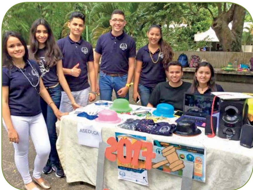
Celebrando la Semana del Estudiante de Derecho