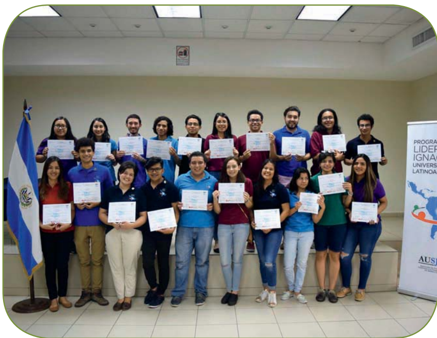
Graduados del Programa de Liderazgo Ignacio.

El Centro de Asuntos Estudiantiles (CAE) es una instancia de la Dirección de Desarrollo Estudiantil (DiDE) y se encarga de promover el protagonismo juvenil en la comunidad estudiantil de la Universidad; facilita los espacios y gestiona los recursos oportunos para que los jóvenes ejerzan su protagonismo desde la dimensión académica, formativa y de expresión. El CAE realiza también el Programa de Liderazgo Universitario Latinoamericano AUSJAL y el Programa de Formación en Acompañamiento.