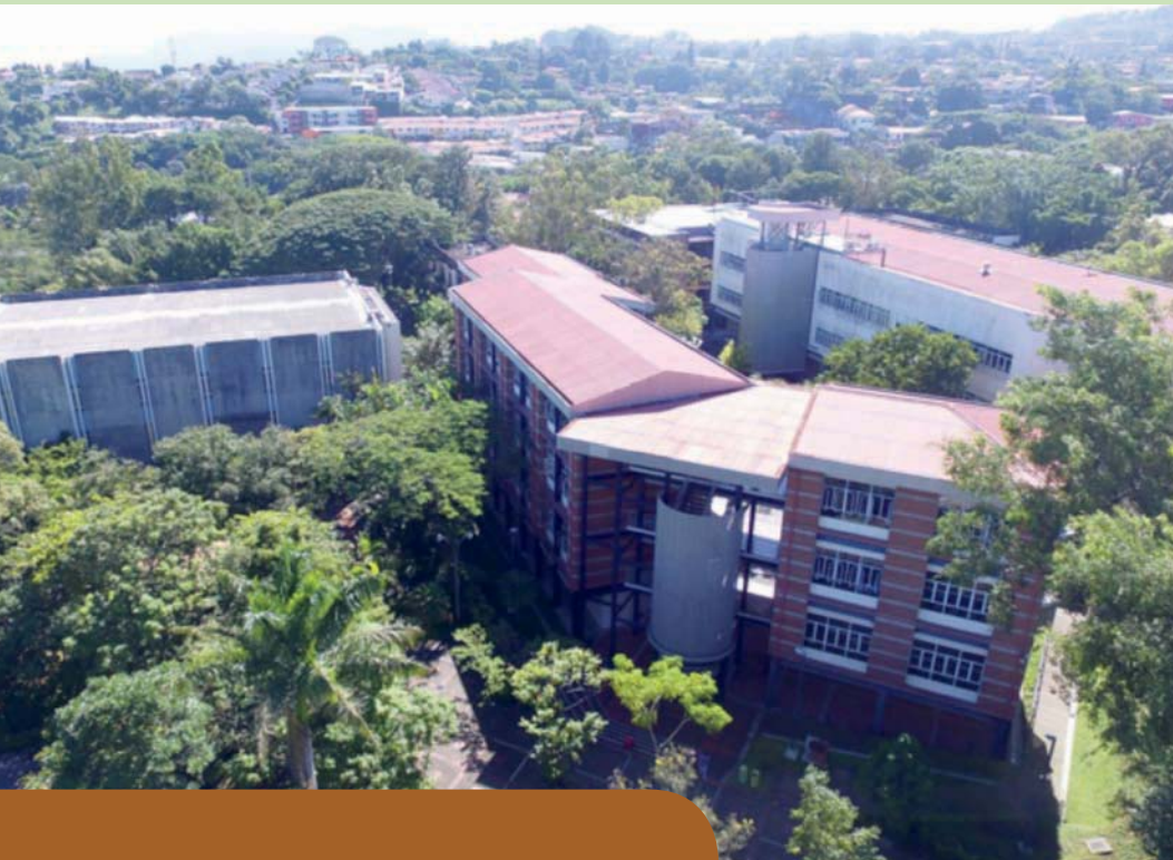
Edificios "D", Biblioteca Florentino Idoate S.J. y Jon de Cortina , S.J.