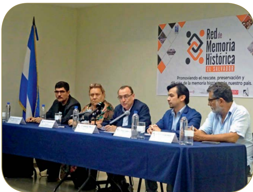
Foro Red de Memoria Histórica, UCA enero 2017.

Los departamentos académicos y las unidades de proyección social de la UCA participan activamente en redes e instancias nacionales y regionales sobre diferentes temas de la realidad. Además, organizan conferencias, congresos, foros, mesas redondas, etc., que tienen alcance tanto a nivel nacional como internacional.