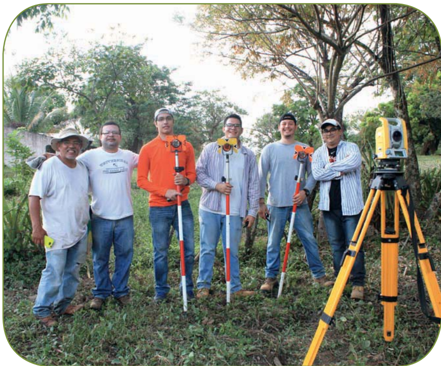
Estudiantes en servicio social, realizando mediciones de terreno en Arcatao.

El eje de formación humanística y social se fortalece a través del servicio social que es coordinado por el Centro de Servicio Social. El servicio social brinda oportunidades para que los estudiantes estén en contacto directo con la realidad nacional y los sectores más necesitados y marginados de la sociedad; y a la vez desarrollen habilidades profesionales en el servicio a otros.