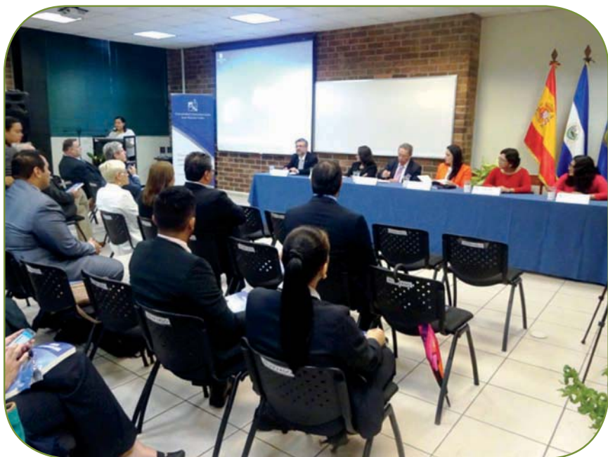
Maestría en Integración Centroamericana presenta el libro Mirada Centroamericana, agosto 2017