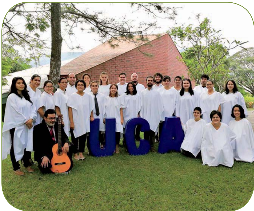
Miembros del Coro UCA 2017.