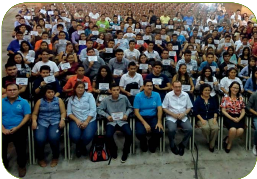
Autoridades universitarias y estudiantes beneficiados con becas parciales UCA, abril 2017

Todas estas posibilidades abren oportunidades de acceso para que estudiantes con escasos recursos económicos estudien en la UCA.