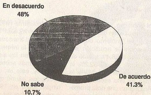
Opinión sobre las tomas realizadas por diferentes grupos sociales

Sobre el problema de la maquila en El Salvador, más de la mitad de los encuestados (57 %) considera que tal problema durante 1995 ha sido producto de la falta de respeto a los derechos laborales en el país, mientras que el 12.6% piensa que es un plan para boicotear la industria de la maquila. El 30.4 % no opinó al respecto.