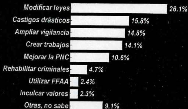
Figura 5: ¿Qué cree Ud. que se debe hacer para combatir el problema de la delincuencia?

y de mejorar el trabajo de la Policía Nacional Civil (10.6 por ciento), entre otras respuestas.