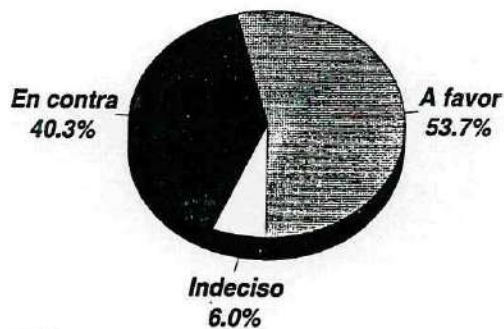
Figura 3. La pena de muerte es necesaria para combatir el crimen. [De acuerdo/Desacuerdo]