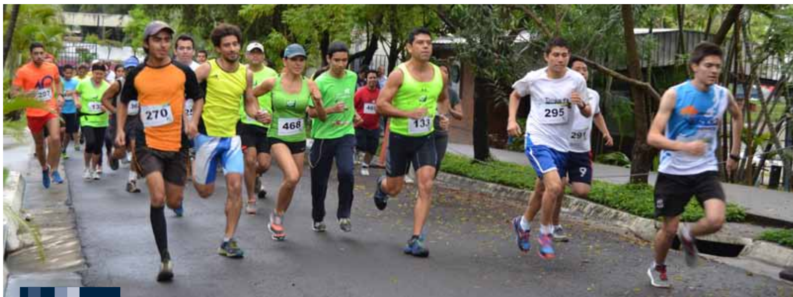
Participantes en la carrera por la solidaridad