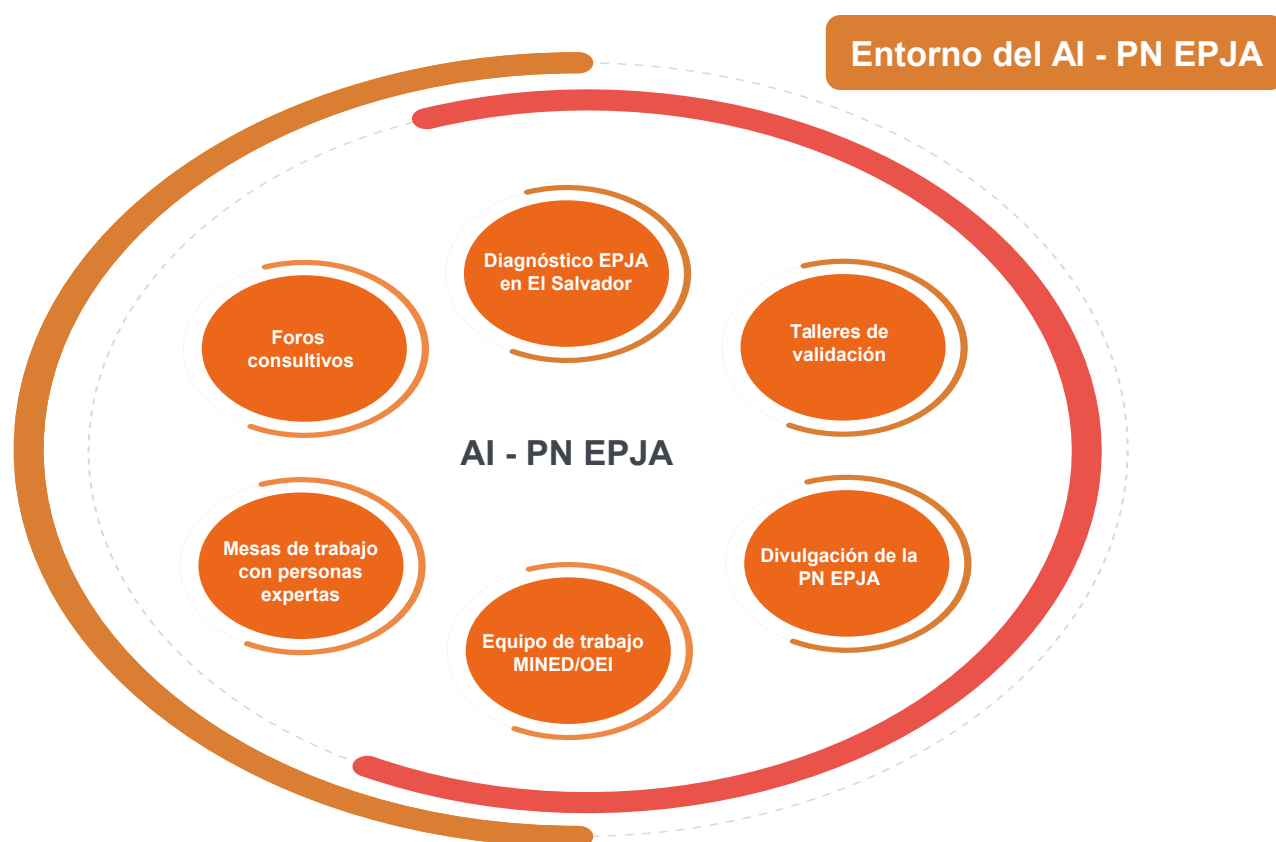
DIAGRAMA 2. ELEMENTOS DEL ARREGLO INSTITUCIONAL PN EPJA (AI-PN EPJA)

institucional (AI-PN EPJA), donde ocurrieron todas las interacciones, operaciones y relaciones que dieron como producto final la política (ver Diagrama 2).