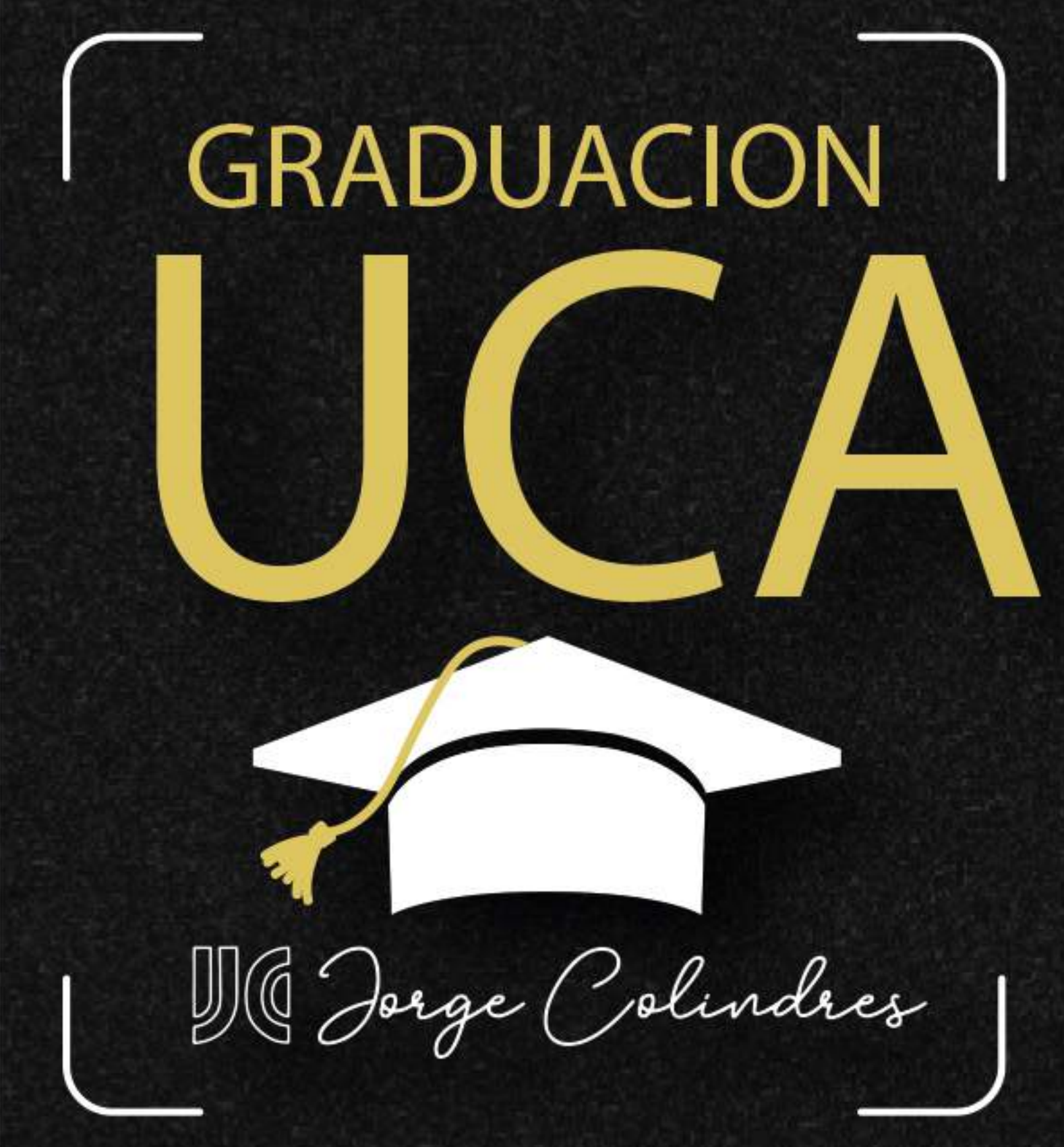
FOTO DE GRUPO